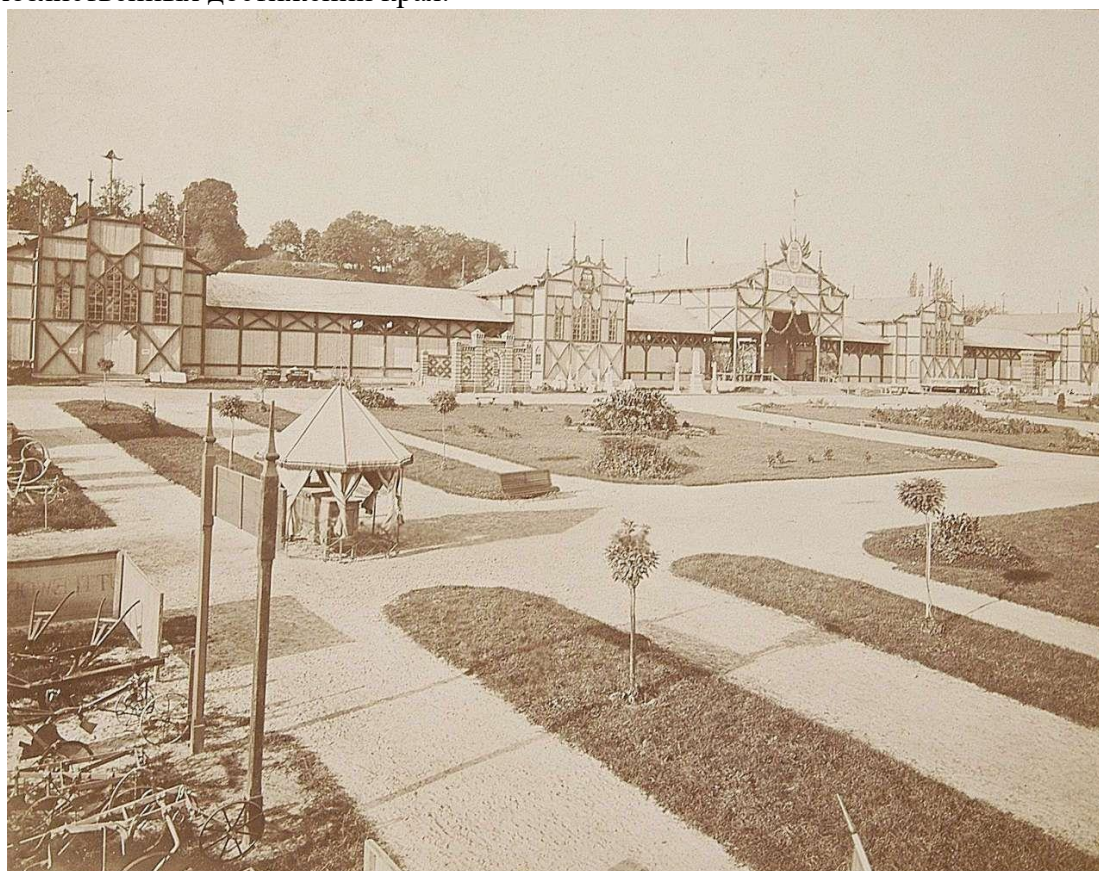
Павильоны аграрно - промышленной выставки на плацу Яблоновских (в настоящее время - площадь Петрушевича). Фото 1877 года

Выставка была распланирована специальной технической комиссией, которая полностью состояла из членов Политехнического общества, одного из наиболее уважаемых в Австро - Венгерской империи. Доминантой экспозиции являлся главный павильон, предназначенный для выставки промышленных и ремесленных товаров, позади возвышался павильон сельскохозяйственных достижений края.