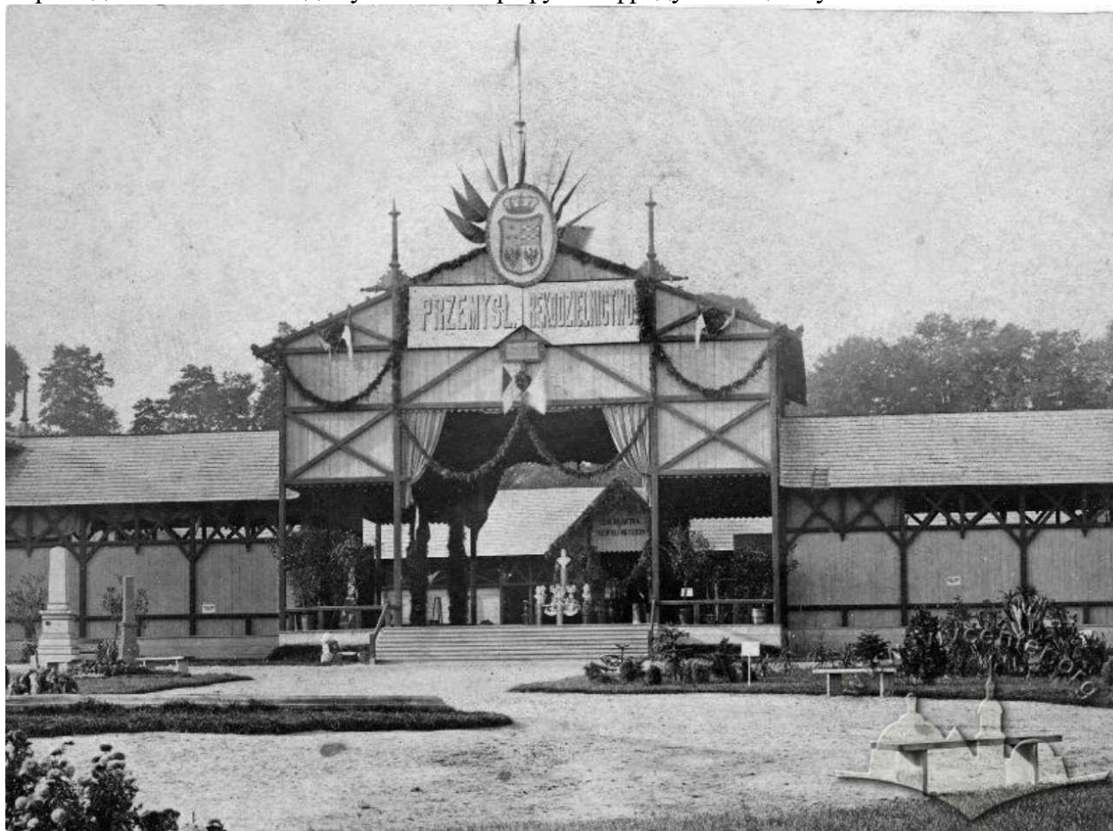
Главный павильон выставки 1877 года во Львове. Фото 1877 года

Экспонаты, которых в общем каталоге мероприятия насчитывалось 1492 позиции, были размещены не только в павильонах, но и под открытым небом или в палатках, это были сельскохозяйственные машины, изделия из каменоломен, пирамиды из угля и кокса, которые символизировали богатство края. Кроме этого на территории были обустроены многие павильоны и киоски с результатами труда и достижениями частных хозяйств. Наибольшие среди них принадлежали князю Адаму Сапеге и графу Альфреду Потоцкому.