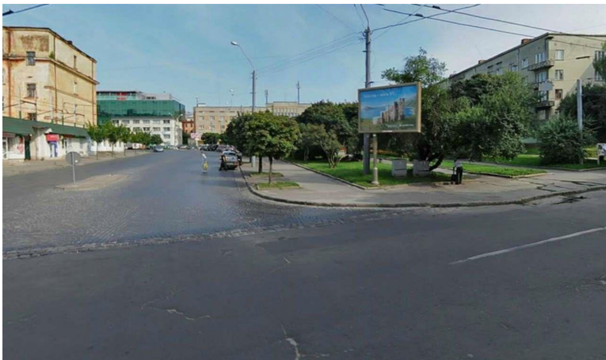
Площадь Петрушевича во Львове, вид с улицы Шота Руставели. Фото наших дней

Выставка была распланирована специальной технической комиссией, которая полностью состояла из членов Политехнического общества, одного из наиболее уважаемых в Австро - Венгерской империи. Доминантой экспозиции являлся главный павильон, предназначенный для выставки промышленных и ремесленных товаров, позади возвышался павильон сельскохозяйственных достижений края.