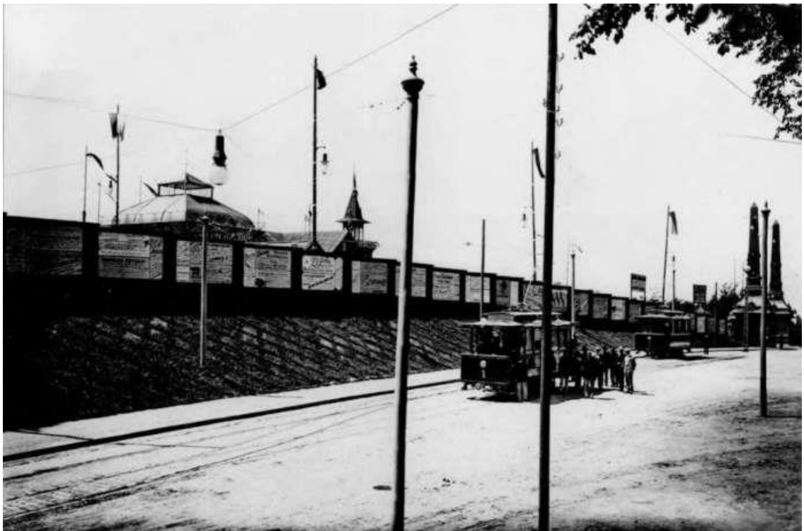
Трамвайная линия вблизи главного входа выставки, нын. ул. У.Самчука. Фото 1894 года

Общая сумма средств на организацию Общей Крайовой выставки в 1894 г. составила около 600 тысяч злотых.