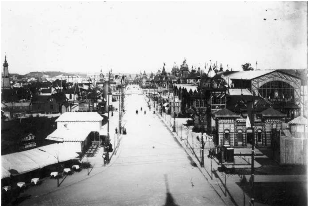
Главная аллея выставки. Фото 1894 г.

Канатная дорога, которая функционировала в течение первого месяца работы выставки, двигаясь с помощью газового мотора со скоростью 1,3 м/сек, преодолевала около 200 м.