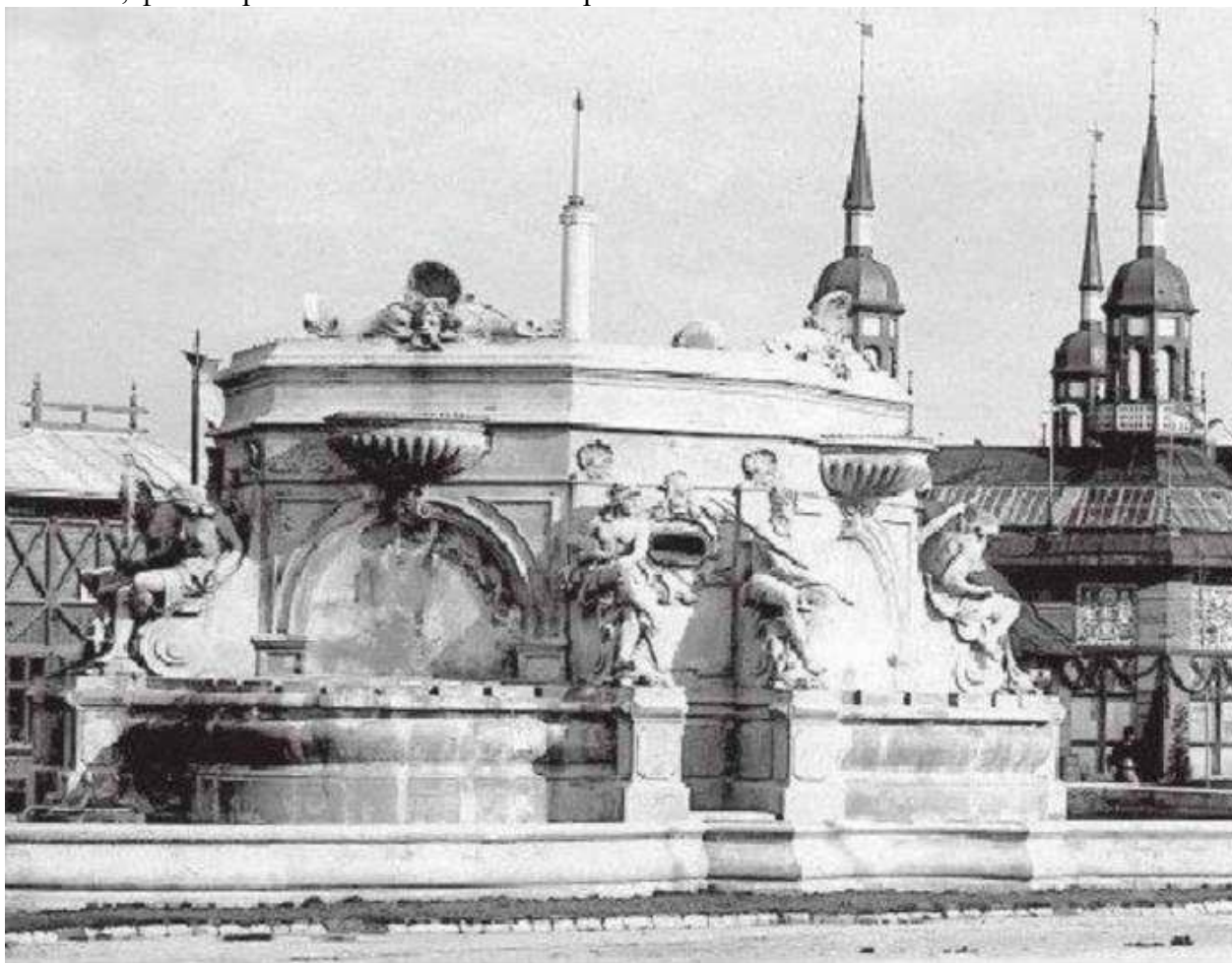
Светомузыкальный фонтан на центральной площади выставки. Фото 1894 года

лампами в сопровождении музыки. Площадь освещали 102 прожектора (12 ампер) и 1500 лампочек, фонтан работал с 9-ти часов вечера.