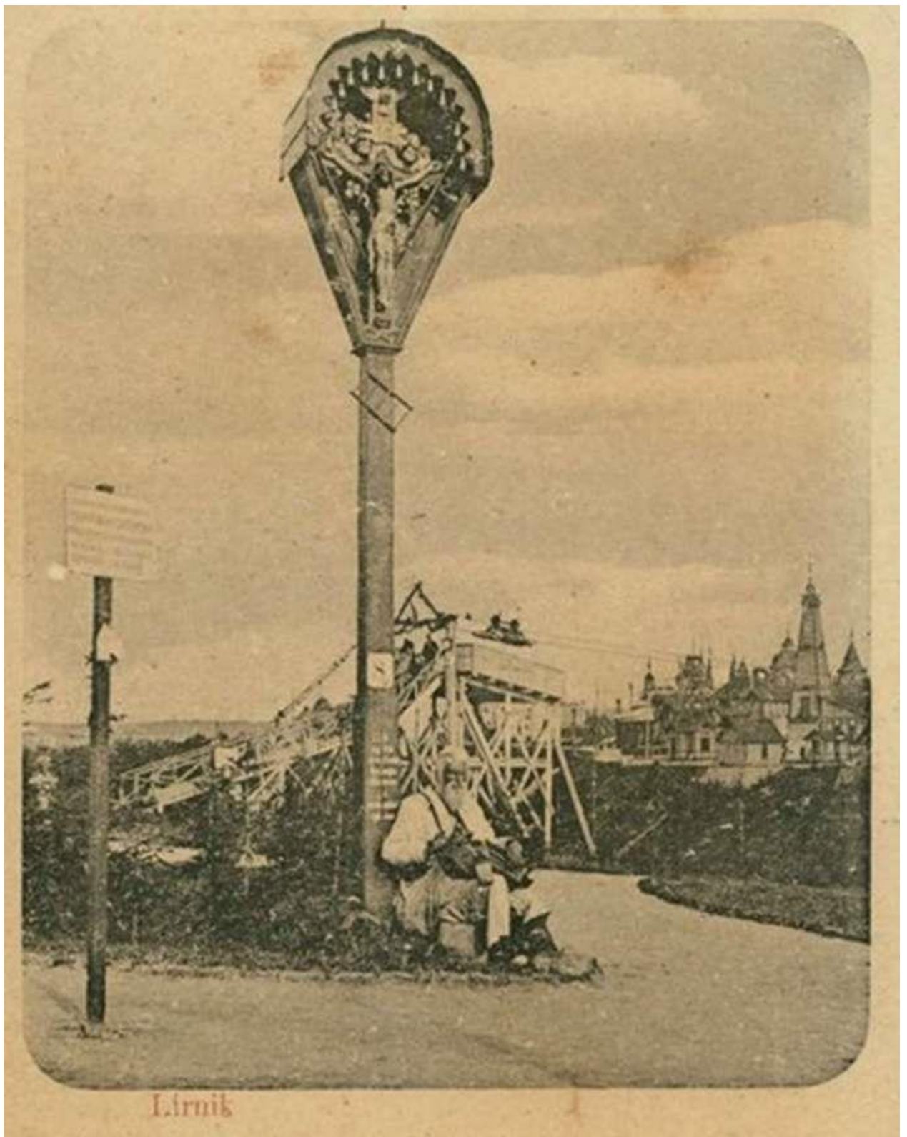
Лирник при входе на территорию этнографического отдела выставки Крайовой. Открытка 1894 года

Искусство на выставке представляли около 800 экспонатов, две тематических группы выставки и 4 специализированных павильона.