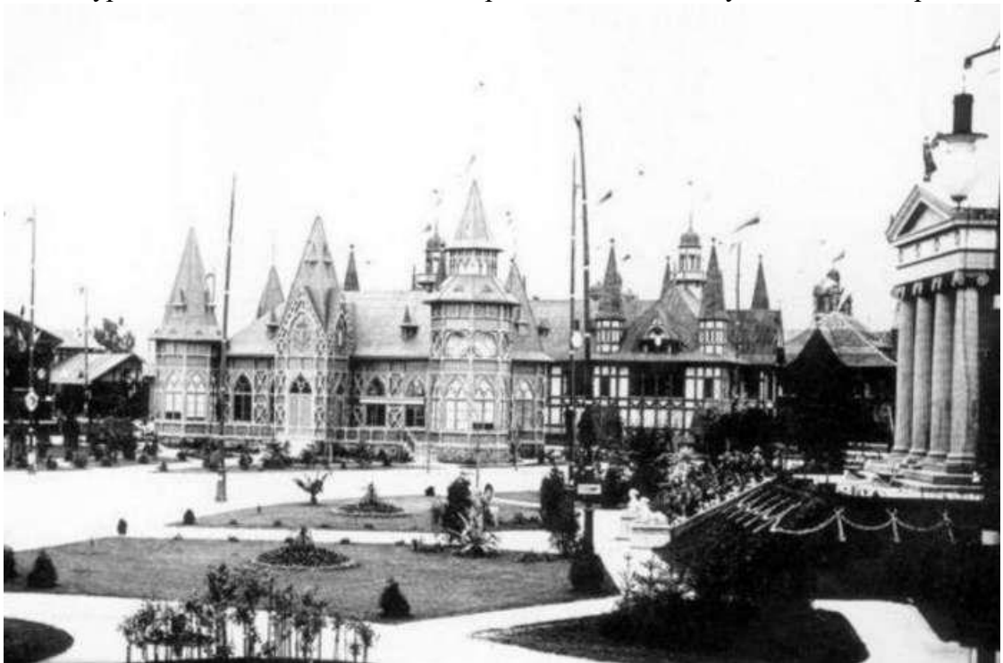
Павильон богатств графа Романа Потоцкого на выставке. Фото 1894 года

На территории нефтяного отдела выставки демонстрировалась система канадского машинного бурения, в течение 8 дней была пробита скважина глубиной 501 метр