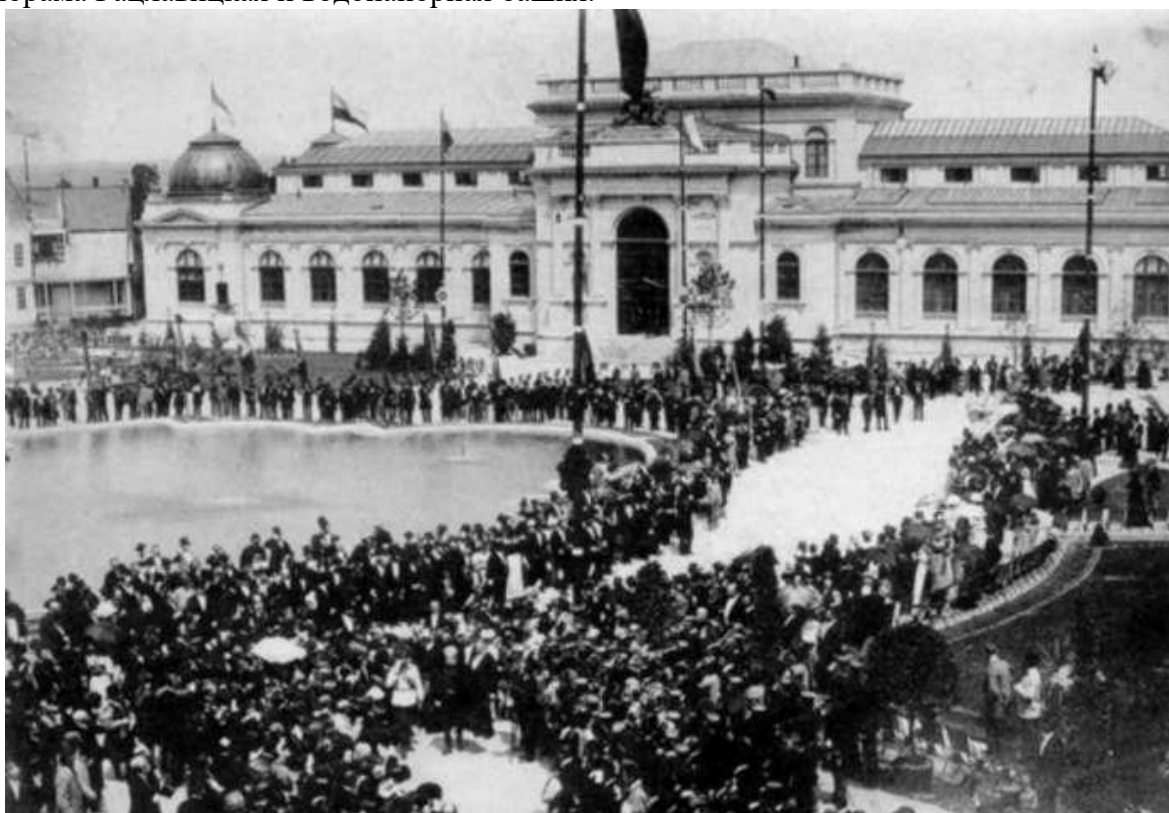
Торжественное открытие выставки 5 июня 1894 года

Только три значительных объекта выдержали испытание временем: Дворец Искусств, Панорама Рацлавицкая и водонапорная башня.