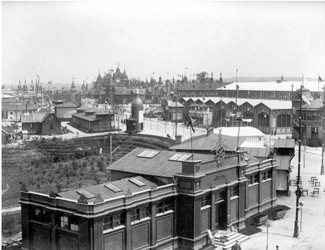
Общая панорама выставки. Фото 1894 года

На территории нефтяного отдела выставки демонстрировалась система канадского машинного бурения, в течение 8 дней была пробита скважина глубиной 501 метр