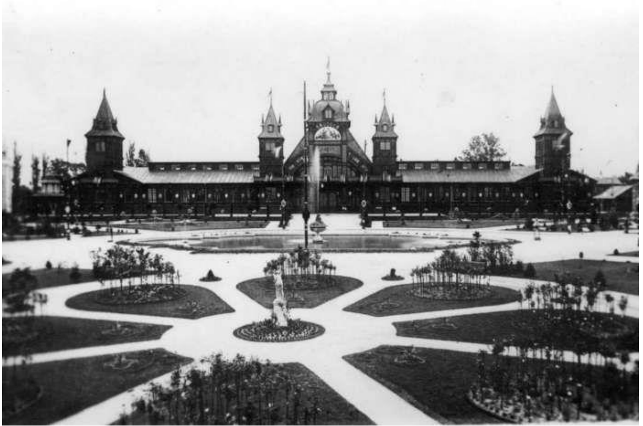
Павильон промышленности на выставке Краевой. Фото 1894 года

Канатная дорога, которая функционировала в течение первого месяца работы выставки, двигаясь с помощью газового мотора со скоростью 1,3 м/сек, преодолевала около 200 м.