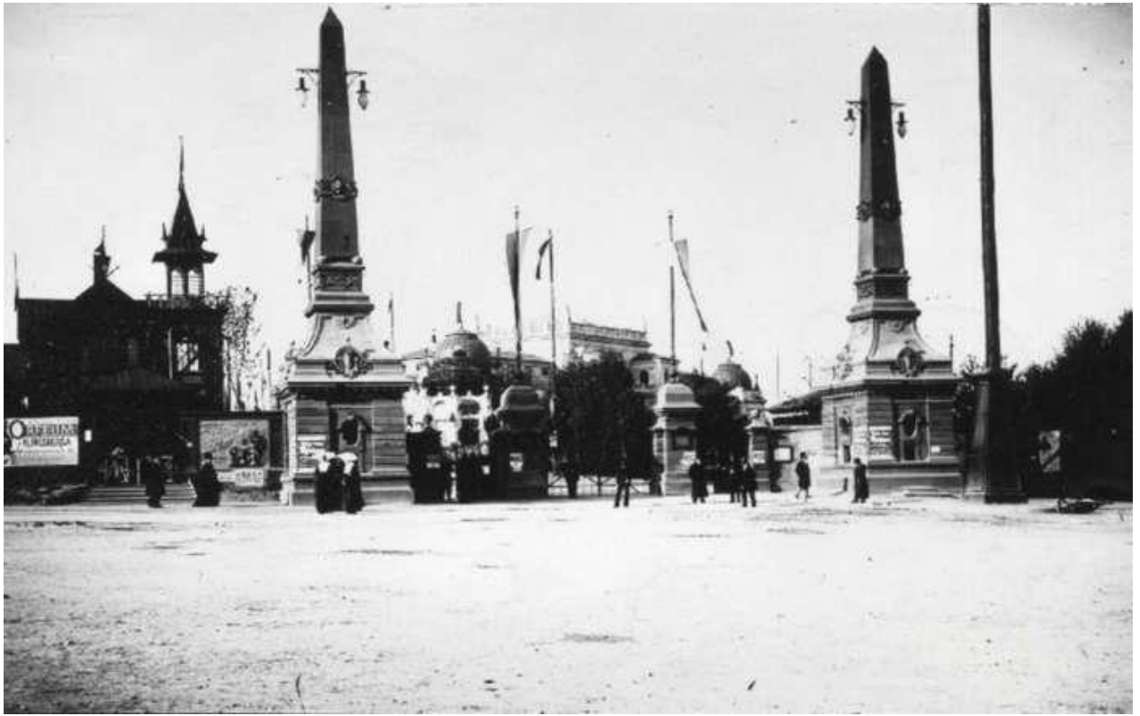
Главный вход выставки Крайовой от нынешней улицы У.Самчука

Общая сумма средств на организацию Общей Крайовой выставки в 1894 г. составила около 600 тысяч злотых.