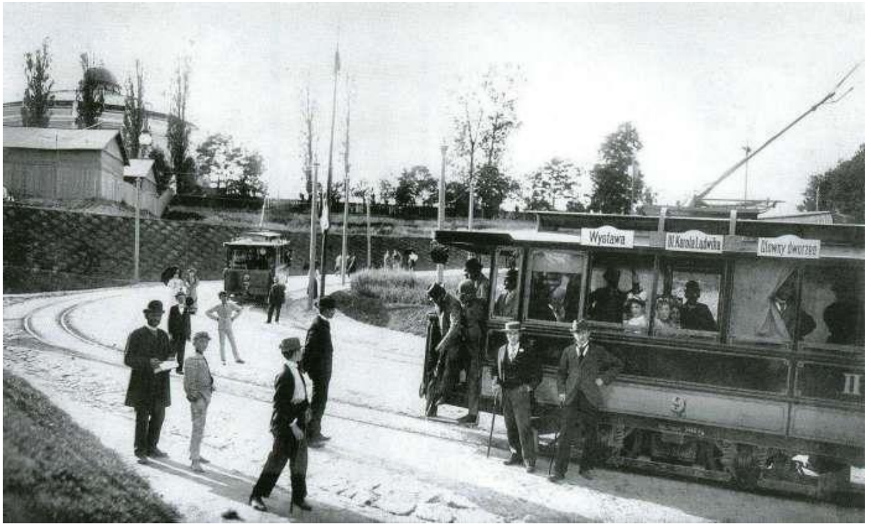
Конечная трамвайной линии Вокзал - Выставка. Фото 1894 года

Только освещение обошлось организаторам события в 80 тысяч гульденов, в то время как сооружение самого роскошного павильона искусств - всего в 60 тысяч.